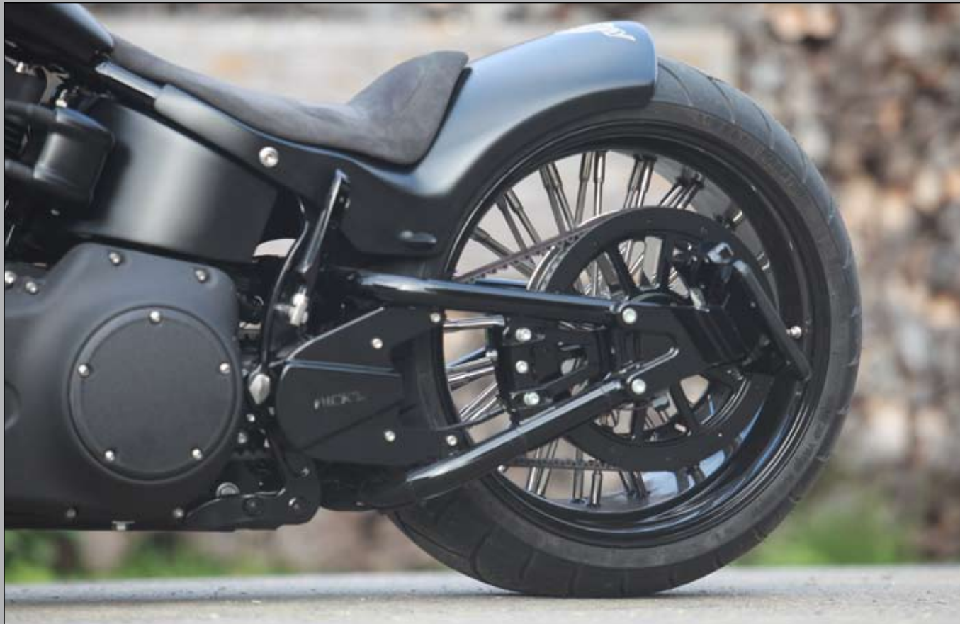
TOP: Rick's 300 Fat Ass conversion with Drive Side Brake System work SUPERB with the clean and highly envied swiss license plates.