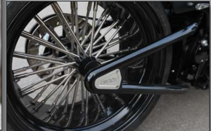
TOP: LED taillight integrated in the Fender metalwork. BOTTOM: Awesome „Big Spoke“ wheel by TTS.

von BSL endet ebenfalls bereits weit vor dem Speicherrad. „Made in Switzerland“ sind hingegen die kompletten Metallarbeiten, die Firmenchef Rainer Bächli bei einem lokalen Blechner exklusiv für seine Umbauten herstellen lässt: Tank, Front- und Heckfender bilden eine harmonische Linie, wobei das mit dem Rahmen verschraubte Heckteil auch den Serien-Öltank integriert. Der Heckfender integriert ein winziges LED Rück- und Bremslicht. Den Lenker baute man selbst, denn in den Untergeschossen des Harley-Himmels ist neben der Service- und Wartungsabteilung ein eigens abgetrennter Raum für Extremum- und Aufbauten mit vollständigem Maschinenpark. Die Lenkerstummel sind unterhalb der Gabelbrücke geklemmt und geben die (fast) passende „Café Racer“ Sitzposition – seh-